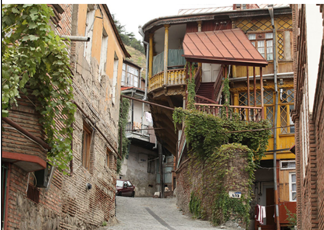
ночь в Тбилиси – гостиница ЦИТАДЕЛЬ НАРИКАЛА